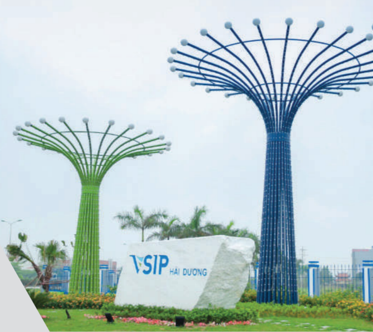
NHÀ MÁY AIRTECH THẾ LONG TỌA LẠC TẠI KCN VSIP HẢI DƯƠNG

Với mục tiêu luôn phát triển bền vững và đem đến cho khách hàng những sản phẩm tinh xảo, và chất lượng cao nhất. Airtech Thế Long luôn là đơn vị dẫn đầu thị trường trong nước về ứng dụng công nghệ Nhật Bản, hiện đại bậc nhất trong thiết kế, thi công và sản xuất thiết bị phòng sạch, thiết bị y tế. Mỗi công đoạn trong các khâu sản xuất đều được thực hiện tự động hóa trên dây chuyền công nghệ hàng đầu thế giới.